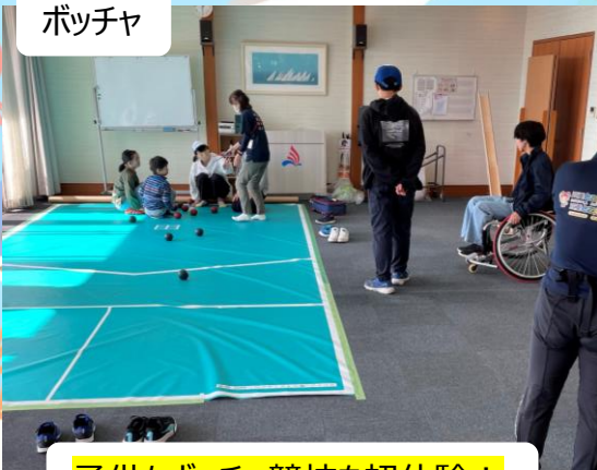
子供もボッチャ競技を初体験！