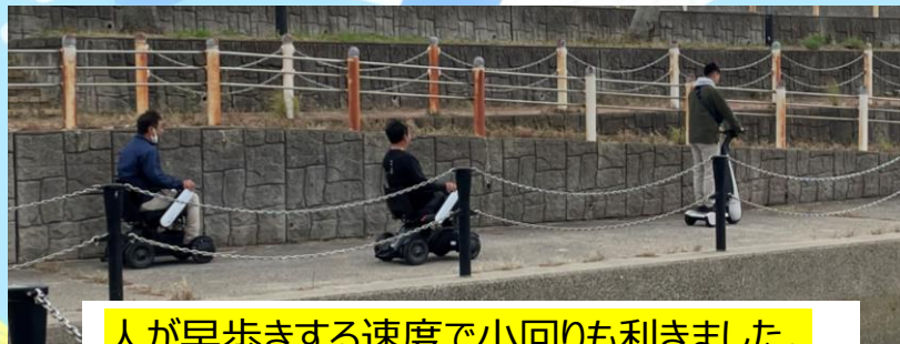
人が早歩きする速度で小回りも利きました。