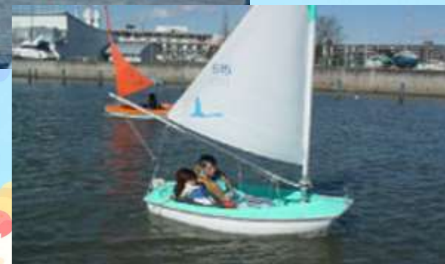
アクヤスディンギー