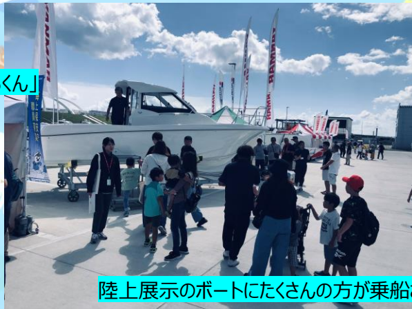
陸上展示のボートにたくさんの方が乗船されました。