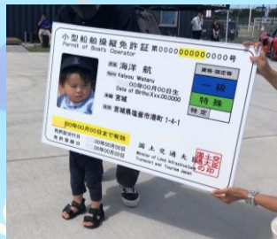
キッズボート免許！ お父さんお母さんが写真を たくさん撮られました。