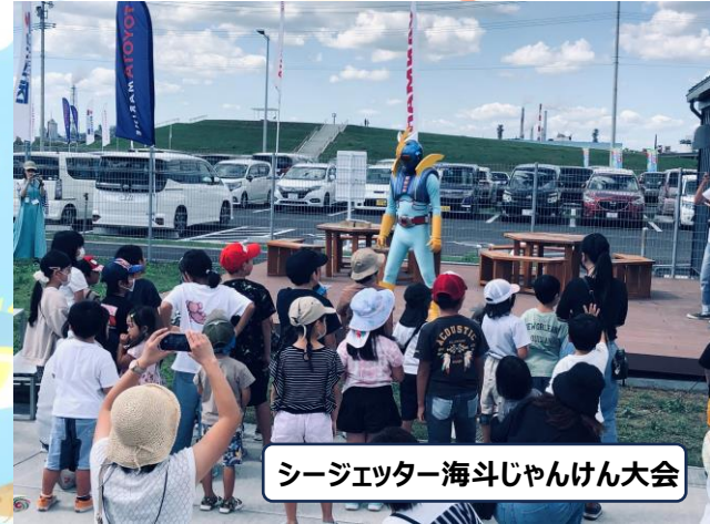
シージェットー海斗じゃんけん大会