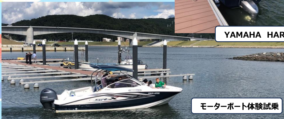
モーターボート体験試乗