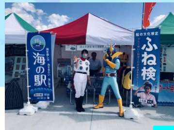
シージェットー海斗 キッズふね検を応援！